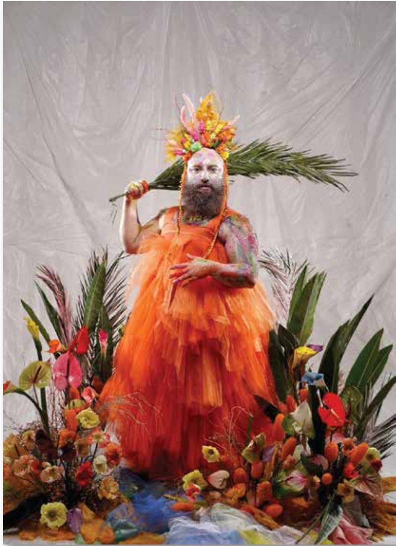
ART TRANSMISSIO / concept and design by ispeaktoflowers