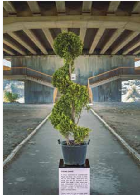
FUTURE LOVERS / art installation by Mischa Badasyan

Միշա Բադասյանը ծագումով Ռուսաստանից հայ կատարողական արտիստ և ակտիվիստ է, ով բնակվում էր Բեռլինում, այժմ Ցյուրիխում: Հաստատապես հավատում է հասարակության վրա արվեստի ազդեցության ուժին և նրա ներդրմանը սոցիալական կառուցվածքների հարցականի տակ դնելով և բարձրաձայնելով մի շարք խնդիրներ: